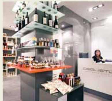
01. Mercado de San Antón 02. De Gusto