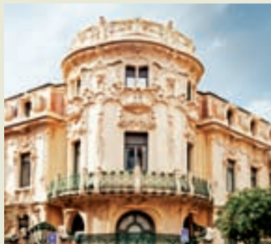
01. Calle de Serrano 02. Lavinia 03. Palacio de Longoria

Divide a la ciudad en dos y concentra su actividad económica. Ahí están las sedes de grandes bancos y de otras muchas compañías. Por ese motivo, este es el lugar al que se arriman casi todos los grandes hoteles de Madrid. En su arranque, cuando aún se llama Paseo del Prado , tiene al Ritz y el Palace. Les suceden el hotel Villamagna, el Hesperia, el Intercontinental, el Occidental Miguel Ángel... cuyos vestíbulos son un trájín de altos ejecutivos . Ya al final de la avenida se levanta en una de las flamantes cuatro torres el hotel Eurostars . Para sentir la urbe a nuestros pies.